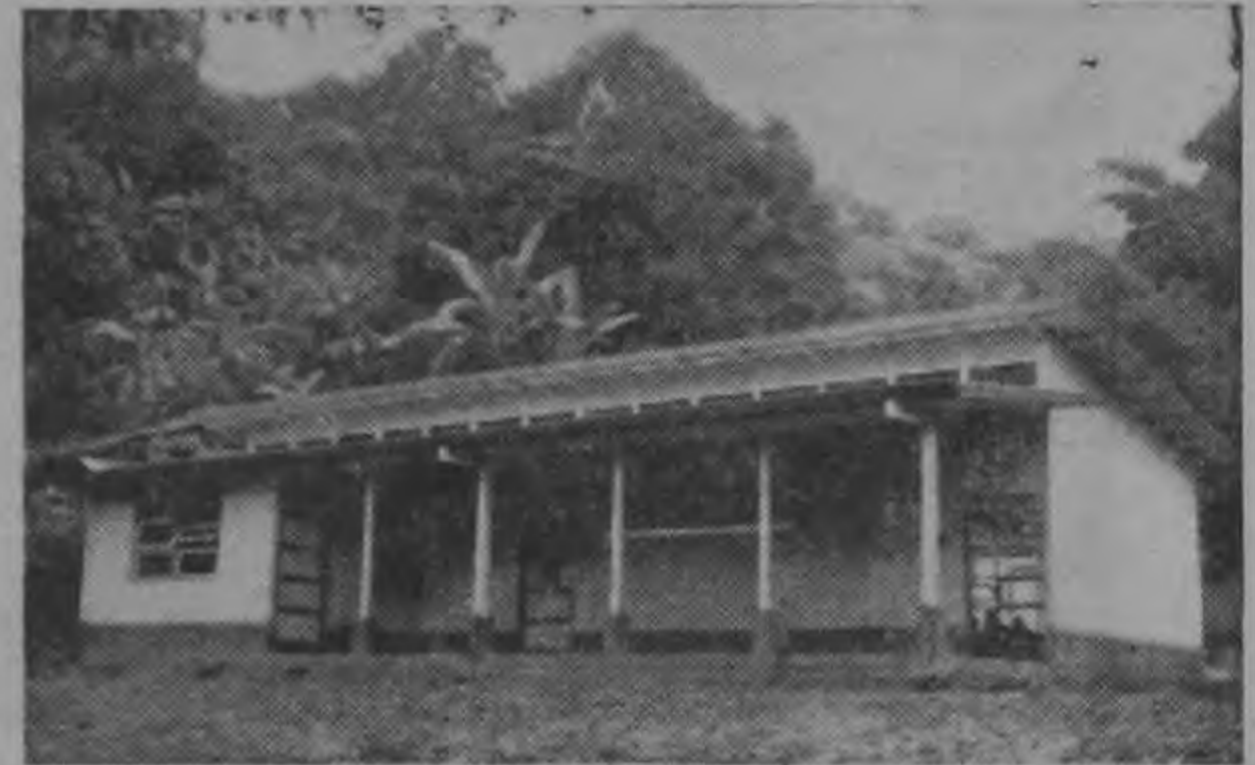
ESCUELA DE PAVAS DE SAN ISIDRO DE ATENAS.— Este bonito y cómodo edificio escolar, fue construido por el Ministerio de Obras Públicas con una erogación de $ 25.000.00. Consta de dos amplias aulas prefabricadas, Dirección y servicios sanitarios. Constituye un valioso jalón en el progreso educativo de la juventud de ese lugar.