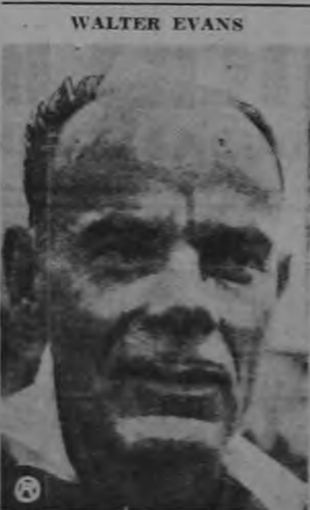
El formidable centro delantero de los veteranos del Cartaginés, que el domingo dio la nota sensacional en el estadio capitalino, con sus grandes jugadas y espectaculars tiros sobre el marco