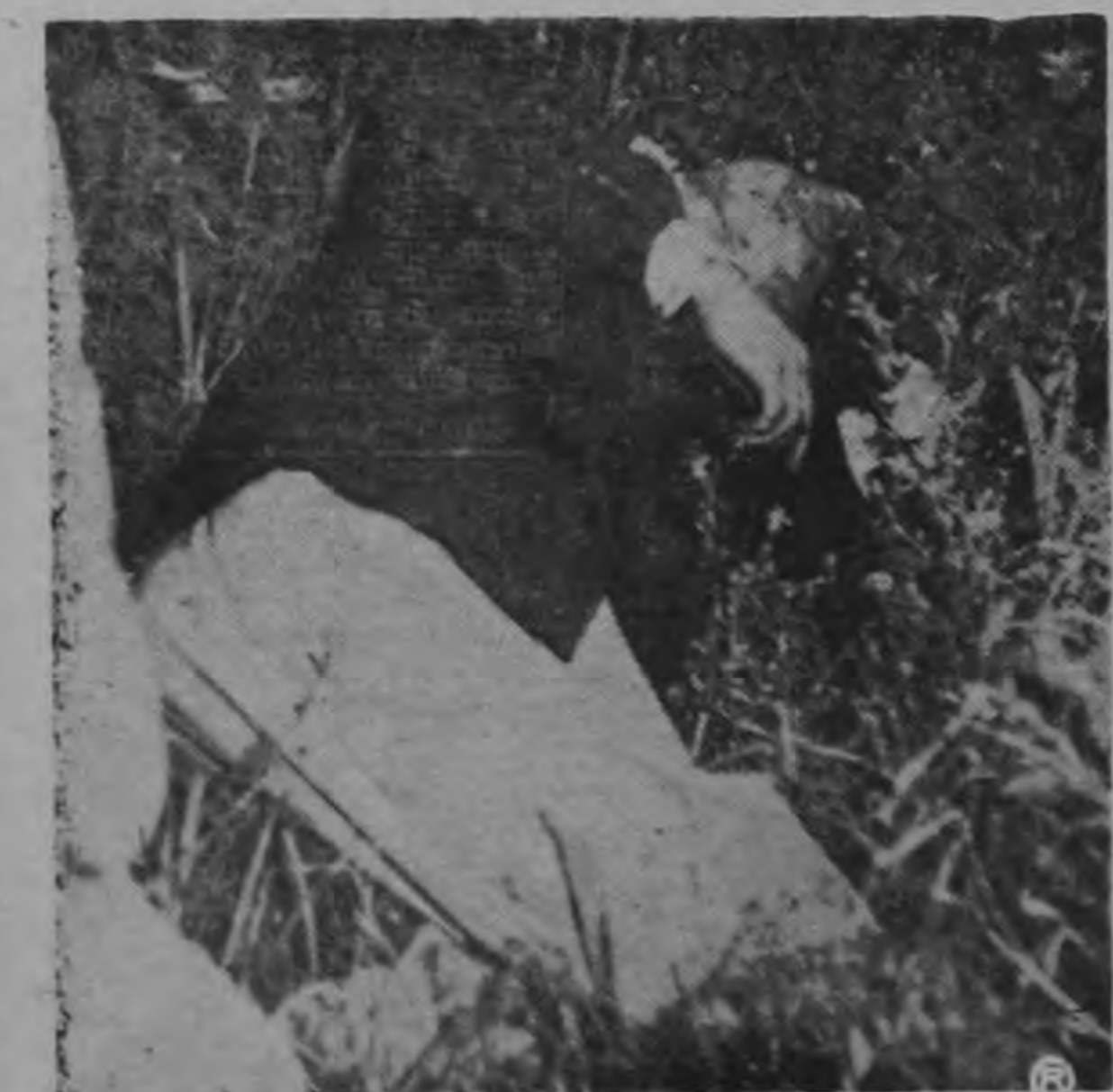
OTRO ASPECTO DEL CADAVER — El brazo y mano izquierda están ocultos. En la mano tenía una cuchilla sospechosamente abierta. En un bolsillo cargaba el revólver. Lo que extraña es, que teniendo un arma de fuego, Arias optara por usar la cuchilla que, desde todo punto de vista era más difícil usar.