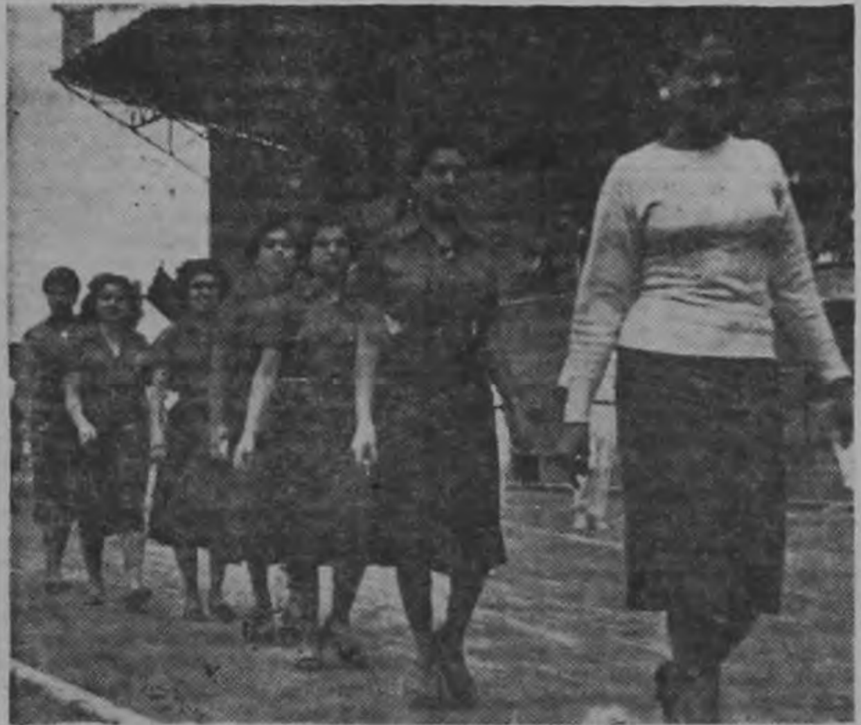
Las encantadoras muchachas futbolistas de los equipos América e Independiente tomaron parte en el desfile inaugural del campeonato de veteranos poniendo la nota de hermosura y belleza. Fueron muy aplaudidas por el público que miró con buenos ojos su aporte al mayor lucimiento de la ceremonia inaugural.