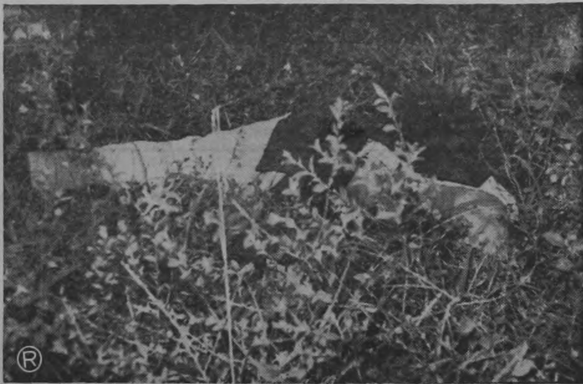
DE COSTADO — Posición en que fué hallado el cadáver. La alta hierba hacía difícil su descubrimiento desde la calle, que pasa a unos diez metros de allí. La pregunta es: ¿Fué asesinado allí mismo?