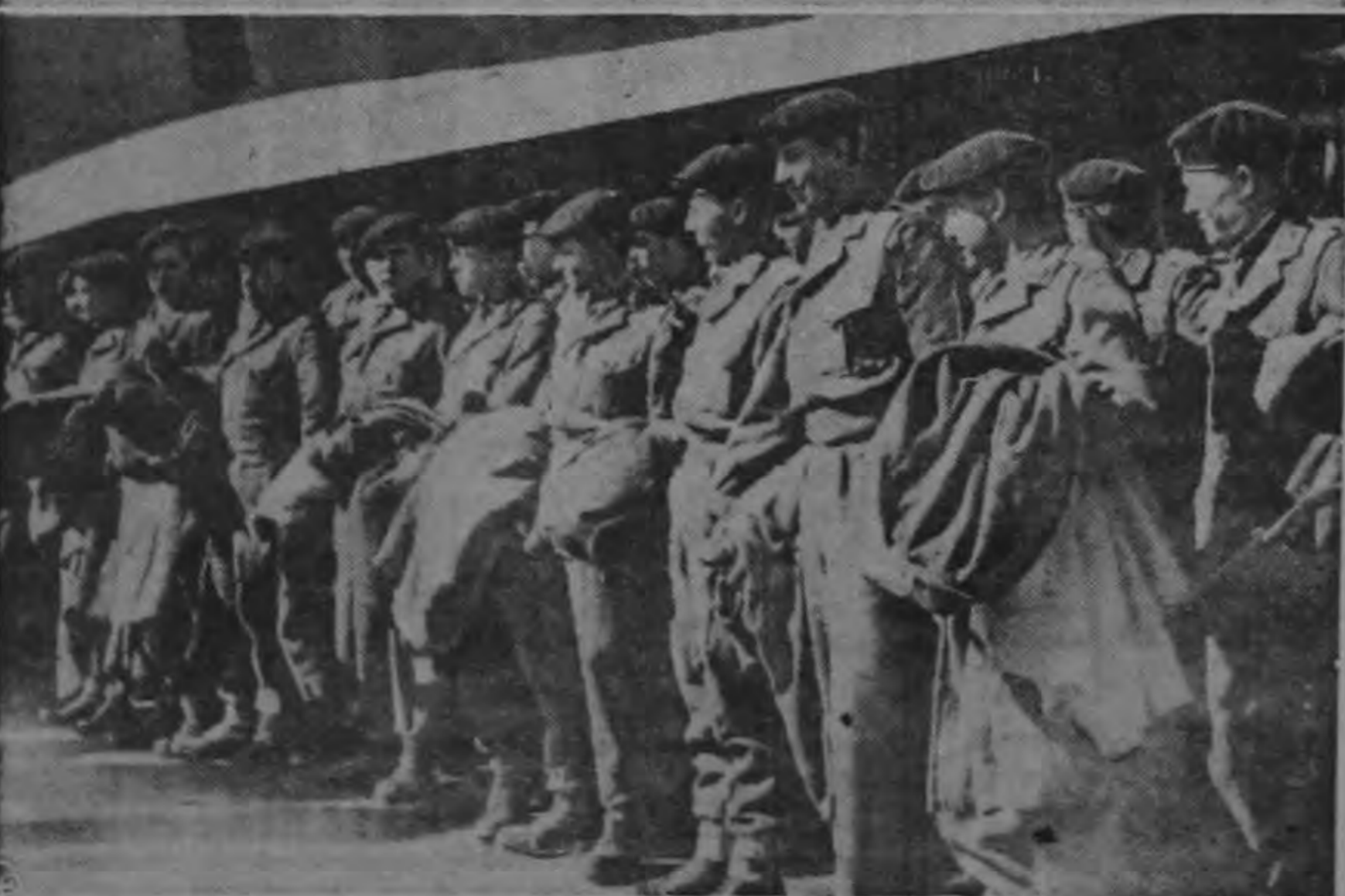
Tripulaciones de tierra de la Real Fuerza Aérea británica (arriba) cargan bombas en una base aérea no identificada en Chipre mientras las fuerzas anglo-francesas se trasladan a la zona del Canal de Suez. Abajo, soldados británicos alineados junto a los aviones transportes para ser transportados a la zona del Canal.